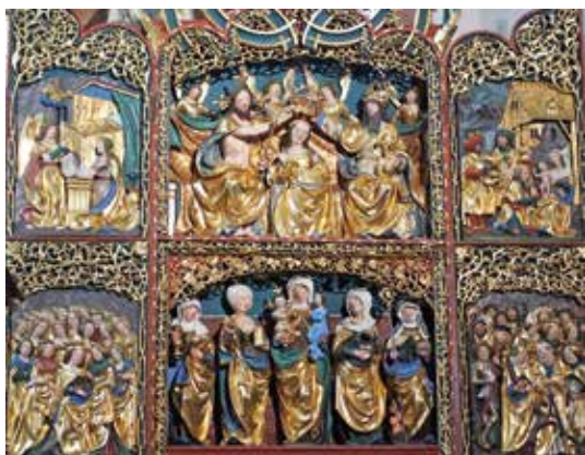
Krilni oltar pri Gospe Sveti

Bernard iz Clairvauxa (1091–1153) je zahteval, da so cerkve cistercijanov skromne, neometane, brez okrasov in barv ter opremljene samo z majhnim nadstrešnim stolpičem. Križ naj bi bil le iz lesa in steklena okna bela. Njegov cilj je bila čim bolj preprosta, skromna in pregledna gradnja iz neometanega kamena.