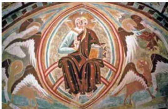
Kristus v mandorli, St. Helena am Wieserberg

( Maria Saal ), župnijska cerkev v Heiligenblu-tu , župnijska cerkev v Hochfeistritz , župnijska cerkev v Kötschachu in podružnična cerkev v