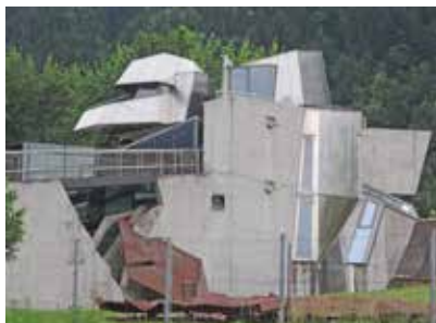
Steinhaus v Steindorfu (Günther Domenig)

Eden najpomembnejših predstavnikov dunajske šole v Avstriji je Ernst Fuchs (1930–2015). Fantazije, sanje, vizije, surrealističnost in iz podzavesti priklicane predstave se obravnavajo kot resničnost in se tako tudi, zvesto tej resničnosti, realistično preoblikujejo v sliko. Bistvo fantastičnega realizma je vključiti v sliko figurativnost, obliko, barvo in podobo v njihovi dragocenosti in razno-terosti. Znani so cerkev v Thalu in kapela v cerkvi sv. Egidija v Celovcu , delo Ernsta Fuchsa , ter župnijska cerkev v Bärnbachu .