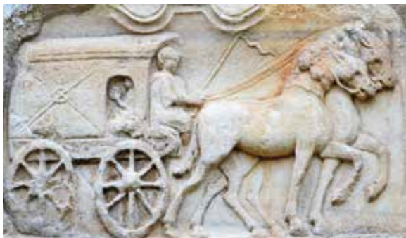
Gospa sveta, voz duš oz. „poštna kočija“

Po preseljevanju narodov in ponovnem pokristjanjevanju alpskega in donavskega območja so v 7. stoletju zrasli pomembni spomeniki. Karolinška umetnost je hotela vzpostaviti povezavo med antičnimi oz. klasičnimi in krščanskimi oz. domačijskimi oblikami.