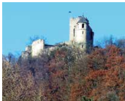
Trdnjava Gösting, Graz