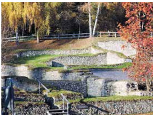
Štalenska gora (Magdalensberg)

Iz časa Rimljanov izvira mladenič s Štalenske gore (Magdalensberg) na Koroškem. Rimske izkopanine so v krajih Teurnia pri Špitalu ob Dravi na Koroškem, v kraju Flavia Solva pri Leibnitzu (Lipnici) , v muzeju v Globasnici/Globasnitz in v Lorchu pri mestu Enns .