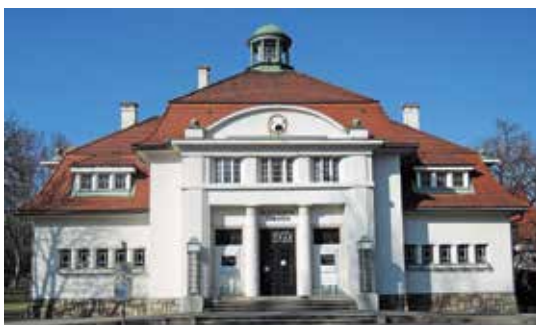
Celovec (Klagenfurt), hiša umetnikov (Künstlerhaus)

neobarok. Evangeličanska Janezova cerkev ob Lendkanalu v Celovcu je prav tako iz dobe historizma kot Heilandskirche (evangeličanska cerkev Zveličarja), Herz-Jesu-Kirche (cerkev Srca Jezusovega), opera, Musikvereinsaal (Dvorana glasbenega društva), mestna hiša, Joanneum in osrednje pokopališče v Gradcu, samostanska cerkev v Admontu na Štajerskem.