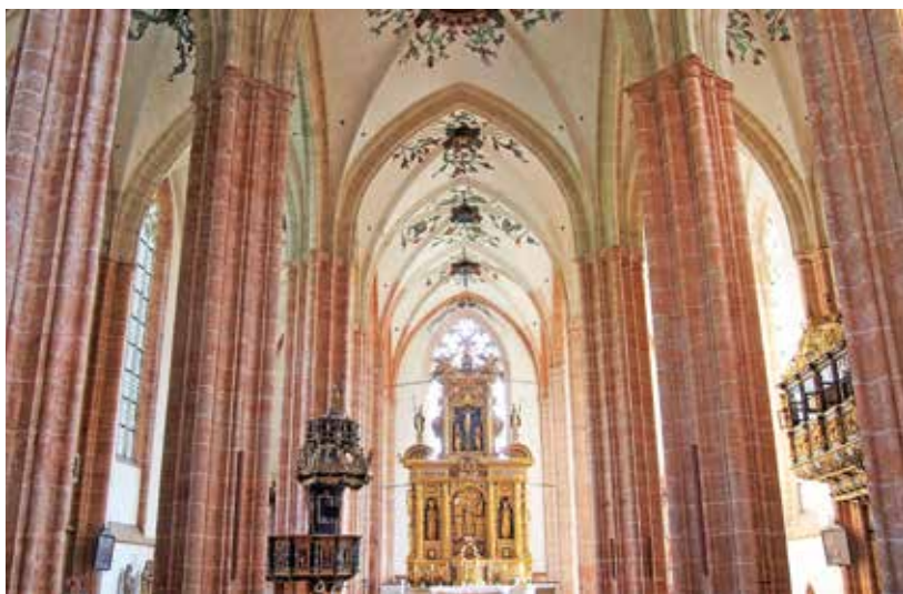
Notranjščina nekdanje samostanske cerkve v Neubergu