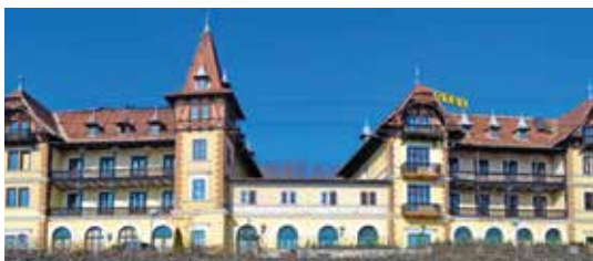
Wörthersee arhitektura (Arhitektura Vrbskega jezera)

filozofija sta dosegla, da se je svet zdel razumsko prepoznaven in obvladljiv. Uveljavljati se je začela predstava o sreči v tostranskosti, religiozni svetovni nazor z onstransko usmerjenostjo se je umaknil v ozadje. Po preobilju baroka in rokokoja so ljudje spet zahrepeneli po naravnem, preprostem, jasnem in pametnem. Gradnjo posvetnih in cerkvenih stavb je začel usmerjati trezni duh, ki pa mu je bila vseeno pomembna reprezentacija. Cerkveno stavbarstvo v jožefinizmu je bilo stvarno, preprosto in brez fantazije. Mistika in globina sta se izgubili. Ker pa so cerkveni krogi klasicizem dojeli kot rezultat razsvetljenstva, ki je odklanjalo religijo, so pri iskanju kakega novega stavbarskega sloga segli nazaj v romaniko. Romantika in restavracija sta našli ustrezno oblikovno govorico v gradbenem slogu gotike – v novi gotiki. Religiozno je iskalo svojo potrditev v konservativni, v preteklost obrnjeni držji, povezani s subjektiviz-