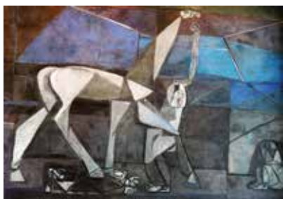
Celovec (Klagenfurt), železniška postaja, stena obtožencev (Giselbert Hoke)