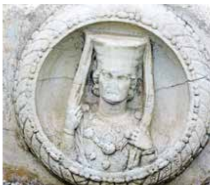
Lendorf, Keltska žena