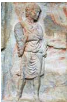
Krnski grad (Karnburg), pisar

Pri gradnji cerkva so bile nove monumentalne stavbe iz kamna, ki so se zgledevale po centralni ali dvoranski gradnji rimskih cerkva. Pri cerkvenih stavbah, ki so nastajale od 4. stoletja dalje, so graditelji prevzeli obliko antične bazilike („ aula regia “). Rimska bazilika je bila zasnovana v četrkotniku in se je prilagajala antičnemu mestu, bila je simbolična odslíkava kozmosa z njegovimi štiri nebesnimi stranmi. Pročelje je ustrezalo mestnim vratom. Vzdolžna ladja s stebri je bila podobna glavni cesti, obrobljeni z arkadami. Z rozetami okrašeni kasetirani strop je spominjal na zvezdno nebo. Prečna ladja je predstavljala glavno prečno cesto k cesarskim rezidenčnim prostorom s slavolokom. Korni obok je vodil v apsidno, prestolno dvorano cesarja. Zgodnjekršćanske cerkve na Koroškem so ustrezale tipu bazilike, čeprav niso imele prečne ladje. Koroška ima iz časa zgodnjega krščanstva največ nekdanjih cerkvenih stavb na Gori sv. Heme/Hemmaberg pri Globasnici/Globasnitz , kjer je bila velika romarska božja pot v pozni antiki. Bazilikalne gradnje pozne antike ne smemo zamenjevati s častnim naslovom bazilika.