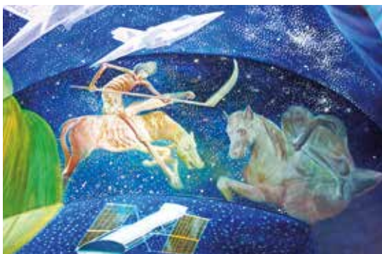
Apokaliptična kapela v cerkvi sv. Egidija v Celovcu, Mrtvaški ples (Ernst Fuchs)