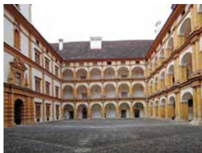
Dvorec Eggenberg v Gradcu (Schloss Eggenberg, Giovanni Pietro de Pomis)

Barok ima duhovno ozadje v verskem obnovitvenem gibanju v drugi polovici 16. stoletja. Značilni zanj so prekipevajoče življenjsko občutje, na novo pridobljena samozavest, čustveno občutje pobožnosti in odrešitev pred turško nevarnostjo. To je privedlo do razcveta gradbeništva – zrasli so številne cerkve, samostani, palače in dvorci. Starejše stavbe, predvsem tiste iz romanike, so pogosto dobile baročno preobleko, pri zvonikih je to pomenilo predvsem čebulaste kupole.