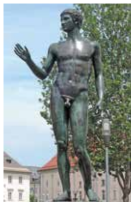
Mladenič s Štalenske gore