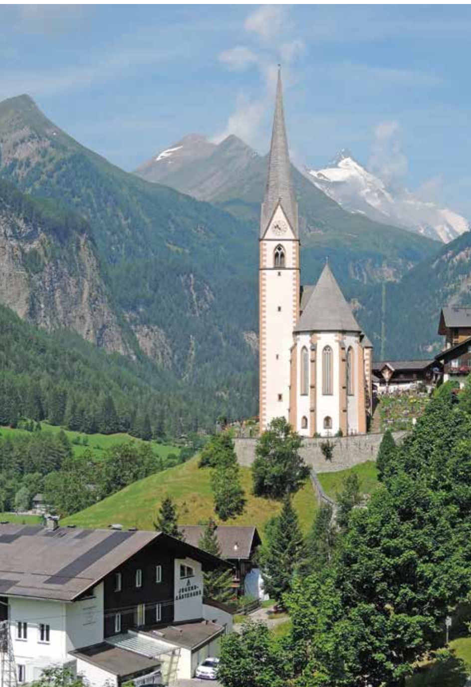
Heiligenblut z Velikim Klekom (Großglockner) na Koroškem