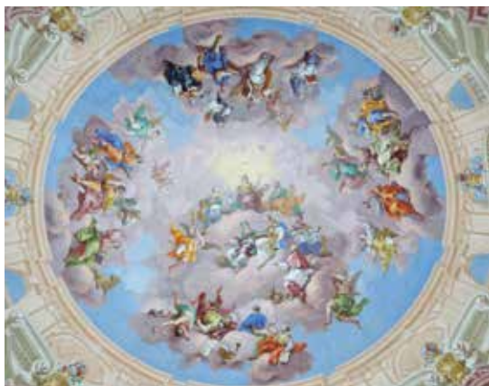
Admont, Božje razodetje z evangelisti in s cerkvenimi učitelji (Bartolomeo Altomonte)

meo Altomonte (1694–1783), Martino Altomonte (1657–1745), Daniel Gran (1694–1757), Paul Troger (1698–1762), Franz Carl Remp (1675–1718), Matthias von Görz (1670–1731), Martin Johann Schmidt („Kremser Schmidt“, 1718–1801) in Johann Cyriak Hackhofer (1675–1731).