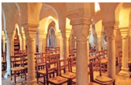
Kripta v Krki

Od 12. stoletja so ljudje spremljali dogajanje v naravi in ugotavljali njegove zakonitosti. Logično mišljenje se je povežalo v simbiozo z versko-mističnim pogledom in se razvilo v celovito razumevanje duhovnega in čutno zaznavnega sveta. Slogovne prvine gotike so bile zašiljeni loki, križno rebrasti oboki, oporniki, vzpenjajoče se stene, fiale in stolpi. Gotske stavbe so se zanosno vzpenjale nad nizke mestne hiše in nad svet, lepo in vidno so razčlenjevale strukturo nosilnih in povezovalnih gradbenih elementov in posebno skrb namenjale svetlobi. Tenke stene so imele okna, ki so se iztezala tja do obokov. Za učenjake 12. in 13. stoletja je bila svetloba vir vse vidne lepote in vseh vidnih reči ter prvi pogoj za red in vrednost. Portal na zahodu je bil prisposodba vrat v nebesa, nad katerimi kraljuje Kristus kot vladar vesoljstva, okrog njega pa so razvrščeni stvarjenje in liki odrešenjske zgodovine Stare in Nove zaveze. Gotska cerkev je obrnjena proti vzhodu in ima večinoma tloris v obliki križa. Odločen dejavnik gotike je bila naraščajoča težnja k subjektivnemu in individualnemu. Pomembno vlogo sta imeli sholastična teologija in emocionalna mistika. S tem je bilo povežano spoštovanje čutov. Pomembne karakteristike gotske umetnosti so izjemna višina, spremenjen gradbeni okras in napredna tehnika.