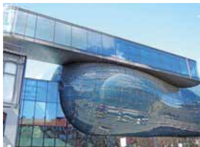
Graz, Kunsthhaus (Hiša umetnosti, Peter Cook, Colin Fournier)