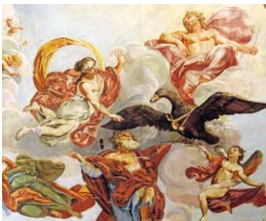
Graz, obok v palači Attems (Franz Carl Remp)

Frauenberg , cerkev na Weizbergu , cerkev v Pölla u in knjižnica samostana Admont .