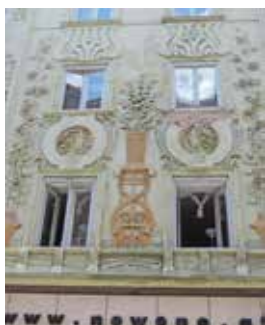
Graz, hišna fasada z jugendstilom v Sporgasse