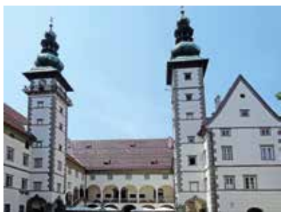
Deželna hiša v Celovcu (Landhaus, Johann Anton Verda)

uporablja v povezavi s stebri in zidnimi venci banjasti obok, kupolo in polkrožni lok. Renesansa ljubi čiste poteze in mirujoče oblike. Njen cilj je sama v sebi mirujoča centralna stavba. Vendar prevladuje zgradba s kupolo v povezavi z bazilikalno vzdolžno ladjo. Tako je nastala jezuitska cerkev. Naravna dnevna svetloba in poudarjanje vodoravnega podčrtujeta „telesnost“ same v sebi mirujoče stavbe. Kiparstvo, slikarstvo in ornament se vključujejo v arhitekturo ter se ji podrejšajo. V slogu renesanse so na Koroškem sezidani gradovi Hochosterwitz (Ostrovica), Landskron (Vajškra), dvorec Porcia v Špitalu ob Dravi , Deželna hiša in notranja dvorišča z arkadami v Celovcu . Na Štajerskem pa Deželna hiša in z arkadami obdana notranja dvorišča v Gradcu , mavzolej nadvojvode Karla II. v Seckauu , mavzolej cesarja Ferdinanda II. v Gradcu , mavzolej Ruprechta in Wolffa von Eggenberg v Ehrenhausnu , Riegersburg in grad Strechau .