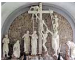
Klasicistični oltar v pokopališki kapeli v Osojah (Ossiach)

mom in individualizmom. Klasicizmu lahko pripišemo skulpturo Križanje v pokopališki kapeli v Osojah (Ossiach).