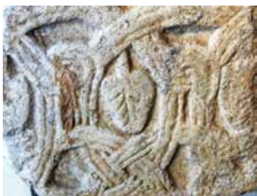
Karolinška umetnost v Molzbichlu

okna so ozka in se končujejo s polkrožnimi oboki. Celo ploski leseni strop bazilike se je moral umakniti obokom. Stene z njihovimi velikimi površinami so zrahljale poslikave. Bog na prestolu v mandorli nad glavnim portalom je simbol razumevanja sveta v romaniki. K razvoju umetnosti so od 12. stoletja pomembno prispevali avguštinski kanoniki, benediktinci in cistercijani s svojimi cerkvami in samostani. Romansko umetnost najdemo na Koroškem in Štajerskem. Ohranjeni so portali, freske in kostnice. Številne cerkve izvirajo iz časa romanike, vendar so bile številne v baroku preoblikovane. Zanimajo se ohranile v prvotnem romanskem slogu predvsem podeželske cerkve. Na Koroškem so stolnica v Krki , samostanska cerkev sv. Pavla v Labotski dolini, nekdanji samostanski cerkvi v Millstattu in Vetrinju , cerkev na Petersbergu v Brežah (Friesach) in podružnična cerkev sv. Helene na Wieserbergu v slogu romanike. Na Štajerskem pa samostan Seckau , podružnična cerkev v Pürggu , kostnica v Hartbergu in nekdanja samostanska cerkev v Gössu .