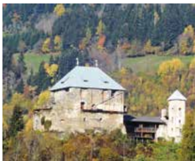
Heunburg pri Vovbrah (Haimburg)

Po letu 1500 se je razvil tip dvorca (Schloss) kot utrjeno bivališče in upravni sedež deželno stanovskega malega in visokega plemstva. Od renesanse in ba-