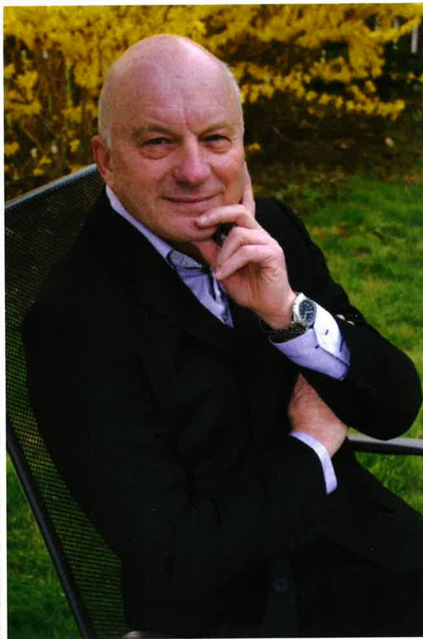
— Valentin Hauser, Autor

Vielen Dank für das Interview lieber Valentin, viel Freude und Erfolg weiterhin für Deine großartigen Buchprojekte und persönlich in diesen Tagen alles Gute!